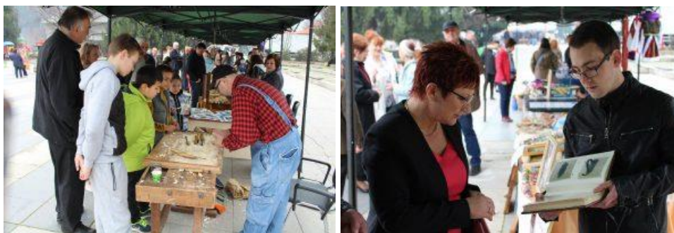
Снимки от събитието в гр.Тетевен

„Европейски дни на художествените занаяти“ е инициатива, стартирала във Франция преди повече от 10 години. От няколко години дни на художествените занаяти се провеждат едновременно в Испания, Италия, Белгия, Латвия, Швейцария, Великобритания, Германия, Унгария, Португалия и Люксембург.