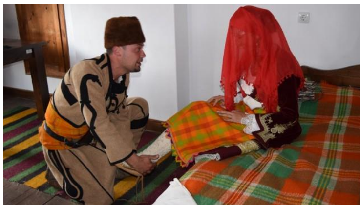
„Крадене на булка“.

направим е, че според местното население за постигане на по-голяма популярност на нематериалното културно наследство на територията на МИГ „Преспя“ е необходимо да бъдат избрани конкретни културно-масови събития, които имат потенциал да привлекат възможно най-широк кръг посетители от цялата страна. Организирането на събития във всички населени места на територията на МИГ под едно общо мото, тема или елемент от нематериалното културно наследство, който би бил най-интересен за посетителите, според участниците в проучването, би бил много добър подход за постигане на синергия и по-голям ефект. Такива потенциални теми и събития, установени въз основа на извършения анализ, могат да бъдат - Масови възстановки по време на празници като Еньовден, Бабинден, Трифон зарезан, възстанови на местни обичаи „Лазаруване“, „Родопска седянка“,