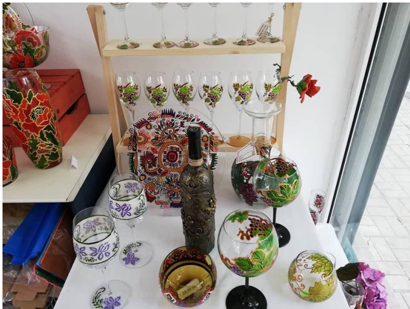
Произведения от стъкло

"Улица на занаятите" във Варна показва красотата на българските традиции. Има една улица във Варна, където човек може да се пренесе в миналото, да се докосне до традициите и занаятите на българския род. Там талантиливи майстори посрещат с усмивка и разказват истории за своя занаят. "Улицата на занаятите" се намира в района на Централния варненски пазар. В специално изградените ателиета могат да се видят творби от стъклопис, иконопис, грънчарство, тъкачество, плъстене, гравьорство и дърворезба, произведения от стъкло. Улицата, на която творят талантиливите занаятчии, е създадена още преди повече от година, като идеята е да се развие като туристическа атракция, която да върне интереса на туристите към пазарите. Майсторите споделят, че на уличката на занаятите могат да се видят предимно авторски неща. На "Улицата на занаятите" може срещнете лъчезарната тъкачка Дари, която създава пъстри черги и с удоволствие демонстрира пред посетителите тънкостите на своя занаят. Майсторът Петко, за когото дърворезбата се е превърнала в начин на живот, неуморно твори в своето ателие и изработва уникални дървени пластики. Акцентът в дейността на уличката на занаятите е