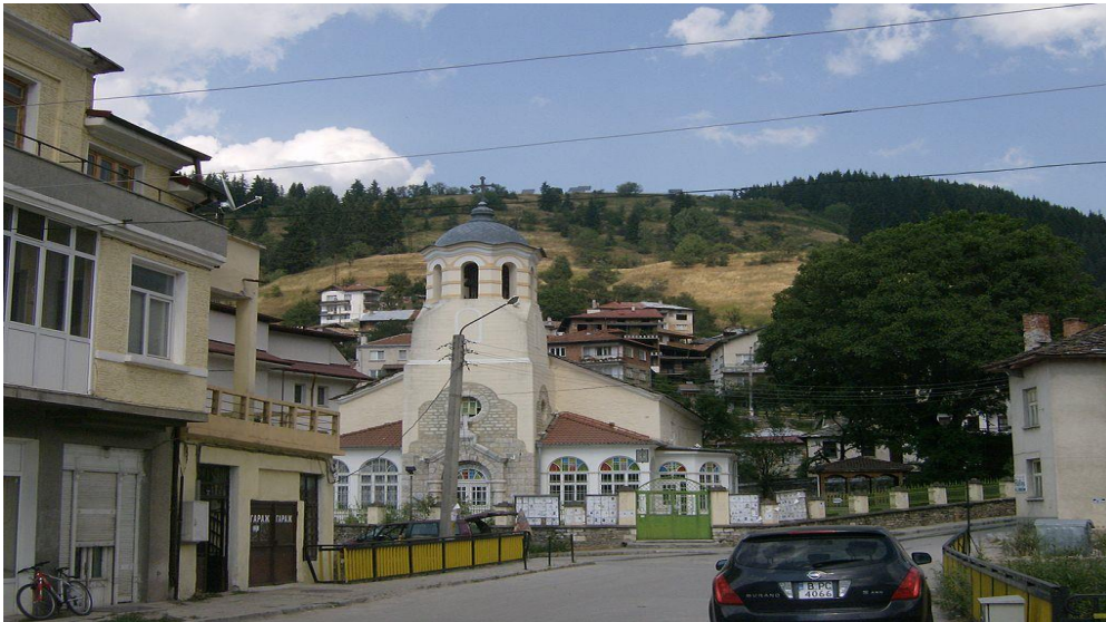
Снимка – гр.Чепеларе

В гр.Чепеларе е създаден Музей на родопския карст, който е уникален за цяла Европа. През 1965 г. учителят от Чепеларе Димитър Райчев организира първата пещерна сбирка, която по-късно се разраства през 1980 г. в пещерен музей – единствен и до днес на Балканите. Днес представлява Музей по спелеология и български карст. Най-старите експонати в музея са от Ягодинската пещера и са на повече от 6000 години.