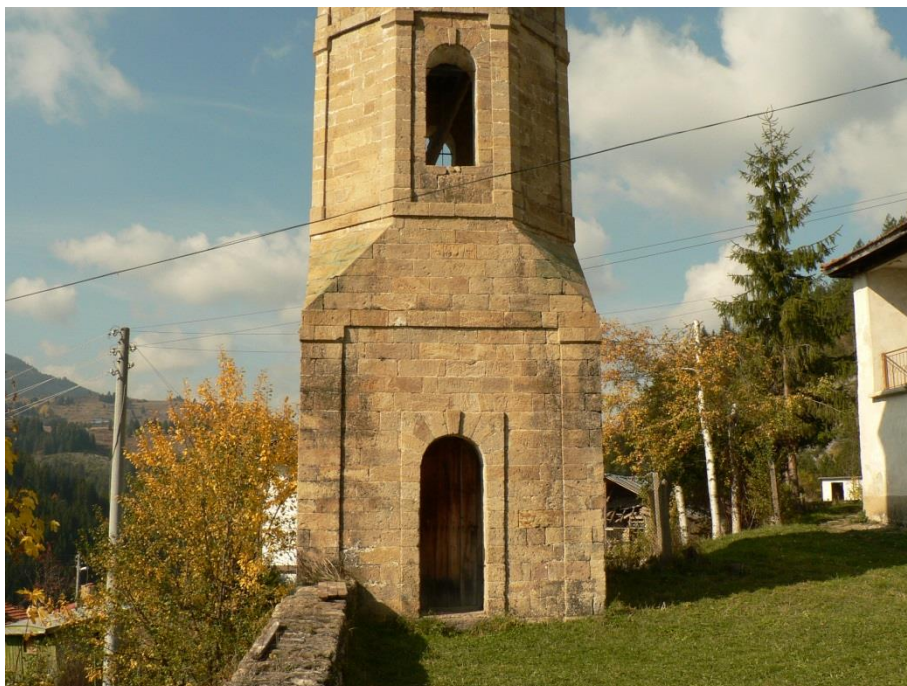
Каменна камбанария, иззидана с дялани камъни

почти никакви инструменти, те градили църкви, къщи, дувари и др.