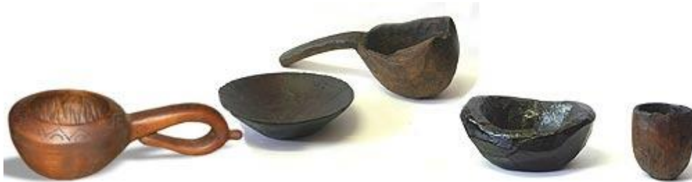
Старинни дървени съдове

Копаничарството наред с дървосекачеството (горянството) е сред най-старите занаяти свързани с обработката на дървото. Копаничарите работели предимно за да задоволят собствените си нужди от груби, но здрави и функционални съдове. Този занаят не изисквал специална подготовка или продължително обучение и сложни инструменти. Той е свързан непосредствено с благоприятните, предимно планински условия в територията на МИГ Преспа, където местните гори изобилстват от разнообразен дървен материал. Най-често използваните дървесни видове предпочитани от копаничарите са орехът, букът, ябълката и сливата, даже и дрянът. Копаничарите-делачи използвали само няколко твърде примитивни ръчни инструменти: обикновен прав нож, изнемало, пергел, евентуално длето и тесла. С тяхна помощ правели множество предмети за лична и домашна употреба: лъжици, геги, кутели (големи чаши с дръжка за вода и мляко), солнички, малки и големи копанки и др. Друга част - типични за времето си дърводелци се занимавали с направата на дограма за прозорци, врати, душета и тавани. Сред най-художествените прояви в дърворезбарството е изработката на иконостаси и църковни тавани, които са се правели само от най-изявените майстори.