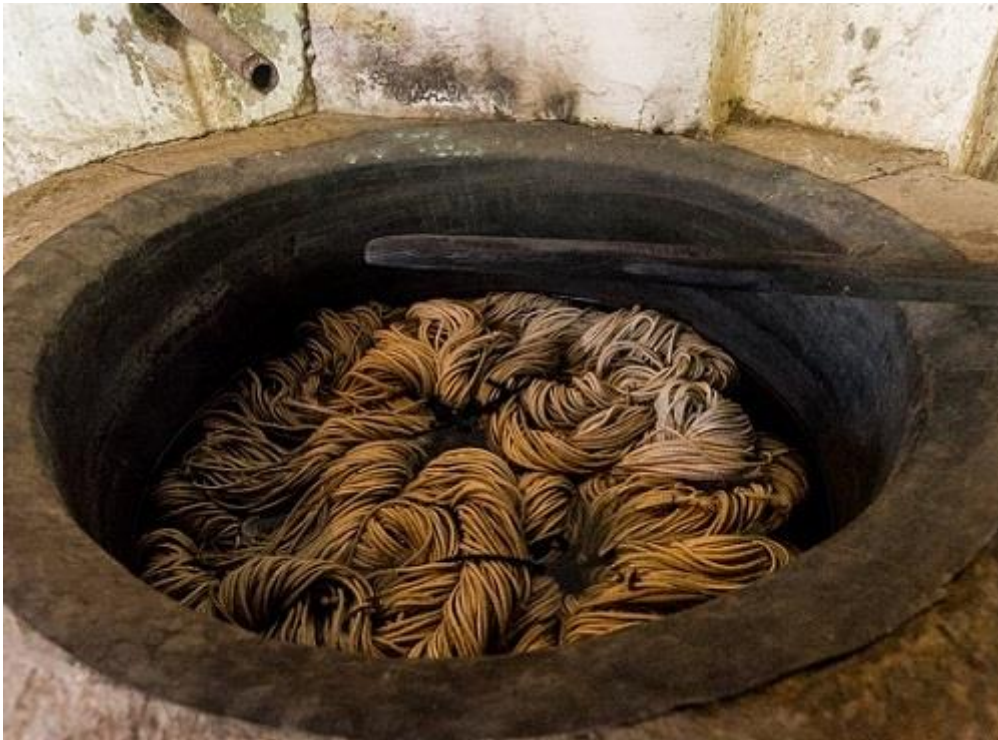
Метод за багрене на гайтан

В определена степен гайтанджийството е развито и в района на МИГ „Преспа“. Гайтанът е плетен вълнен шнур, с който са се украсяват традиционните народни носии, изработени от аба. От практично средство за заздравяване на ръбовете и шевовете на дебелия вълнени дрехи, с годините тези шнурове се превръщат в сложна рисунка и украса. Първоначално са се изработвали изцяло ръчно. По-късно с въвеждането на чекръкът в голяма степен производството се механизирани. Силно развитие гайтанджийството получава след Освобождението - българските гайтани продължават да се търсят на турския пазар, в последствие в резултат на силната конкуренция на фабричните изделия занаятът запада.