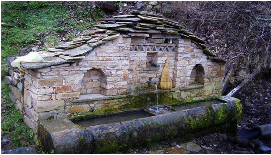
Стара чешма с корито за водопой и на животни

В миналото селската чешма е била място, където освен да си налееш вода е можело да срещнеш своите приятели или бъдещата си невеста и жених. Селската чешма е била център на социални контакти. Чешма обикновено се нарича цялата водопреносна система, чрез която водата достига до хората. В някои случаи над самото съоръжение се е построявала и малка постройка – навес или сайван за по-голямо удобство на хората. В българските земи се срещат различни видове чешми. Тяхното разнообразие се дължи на материала от който са направени, големината на коритото и броя на чучурите. В Родопите и в територията на МИГ „Преспа“ най-често срещаните чешми са каменните, изградени от дялани камъни с по един, два или три чучура. По традиция чешмите са се изграждали по някакъв повод, като на зида на вече построената чешма се гравира името на дарителя или събитието, което трябва да се запомни или ако е в памет на някакво събитие или човека. Тази традиция се пази и практикува и до днес и се смята за голям „хаир“ (добринна) да успееш през живота си дастроиш обществена чешма. Често строежите на чешмите са били обвити в легенди.