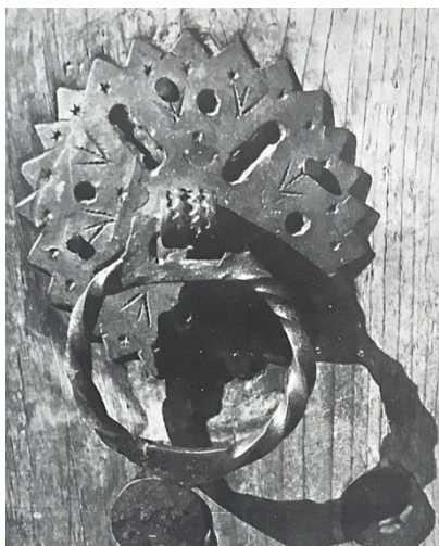
Халка – дръжка за порта от ковано желязо

оръжия и от подковаване на животните, като тези нужди се запазват през годините до началото на индустриализацията.