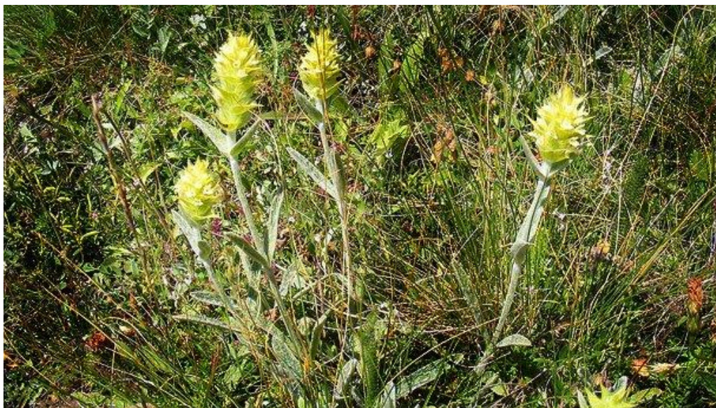
Мурсалски чай – силно лечебен и тонизиращ