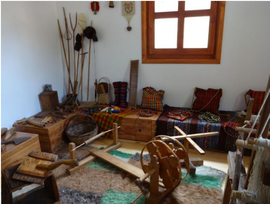
Снимка – интериор на Атрактивна къща „Природа и наследство“

Традиционните дейности в земеделието и животновъдството в община Лъки се практикуват и съхраняват традиционната родопска кухня, свързана с картофопроизводството, млечните и животински продукти. Към тях може да се добави местното пчеларство, рибовъдство, производство на малини, арония, бране на диворастящи гъби, билки и боровинки.